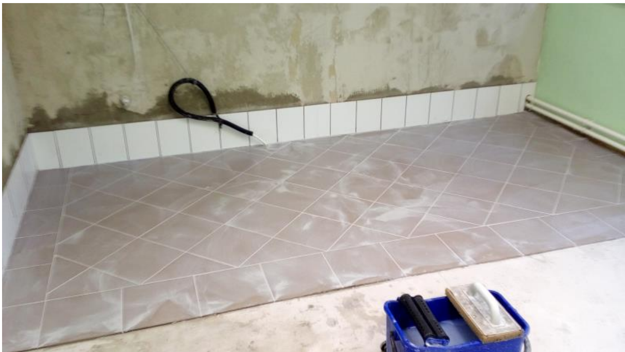
Szakmai vizsga 2023. június - Kerámia falburkolat készítés